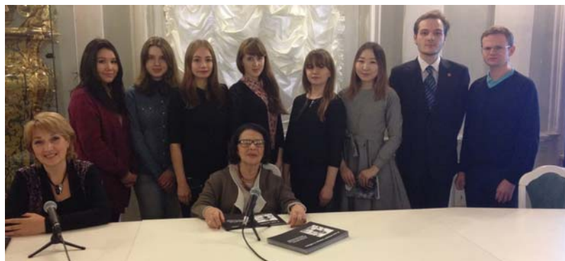
Семинар в Санкт-Петербурге