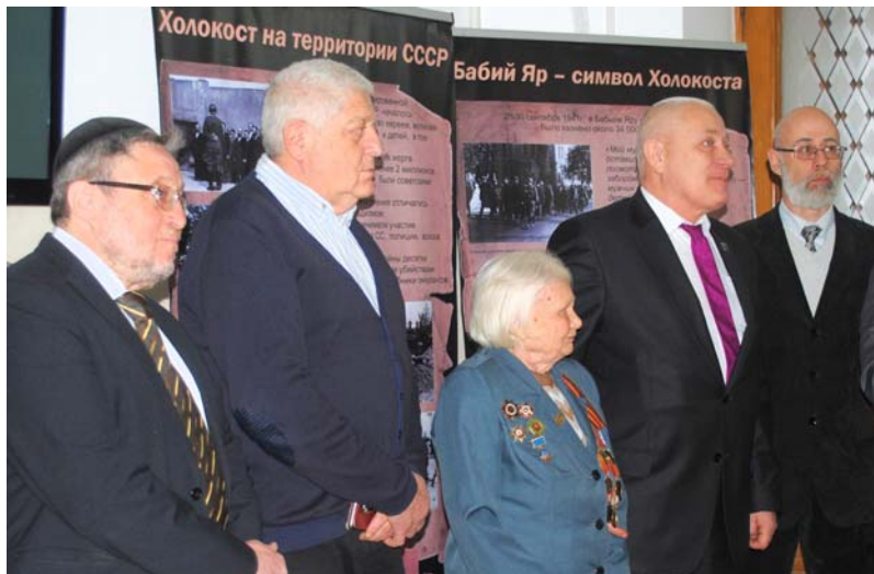
Открытие выставки в Твери с участием мэра (второй справа)

В ходе проекта в архив Центра было получено несколько сот уникальных документов, а партнерским организациям и музеям передано более 1 000 копий документов об освободителях Аушвица из архива Центра. Подготовленные в рамках проекта методические рекомендации по его проведению размещены на сайте Центра «Холокост» и разосланы в Институты повышения квалификации и руководителям школьных музеев.