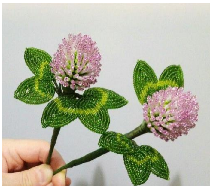
Рисунок 4. Клевер.