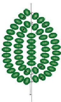
Рисунок 2. Французская техника плетения маленьких листьев.

Отмерить зелёную проволоку (0,3 мм), примерно 25 см, делаем петлю 5 см, оставляя осевой стержень и скручиваем. Набираем на осевой стержень 2 темно-зелёных, 3 светло-зеленых, 2 темно-зелёных бисерины. На рабочую проволоку набираем 2 темно-зелёных, 3 светло-зеленых бисерины и необходимое количество темно-зелёного бисера. Делаем оборот сверху над осевым стержнем под углом 45 градусов. С противоположной стороны, начинаем темно-зелёным бисером, далее - примерно на одном уровне - добавляем 3 светло-зеленых бисерины, продолжаем темно-зелёным бисером. На второй дуге начинаем добавлять 3 светло-зеленых бисерины (чуть ниже предыдущего ряда). И симметрично - с другой стороны. Выполнить заготовку из трех маленьких листиков, собираем между собой и скручиваем концы проволоки.